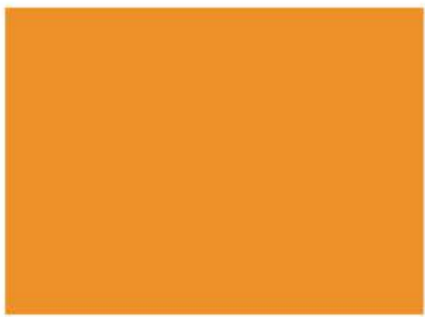
501 - Albero Maestranza