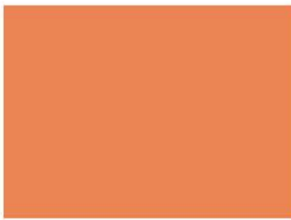
502 - Arcilla