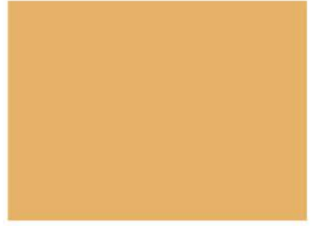
509 - Calabaza