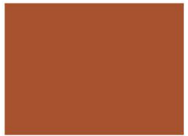
503 - Whisky