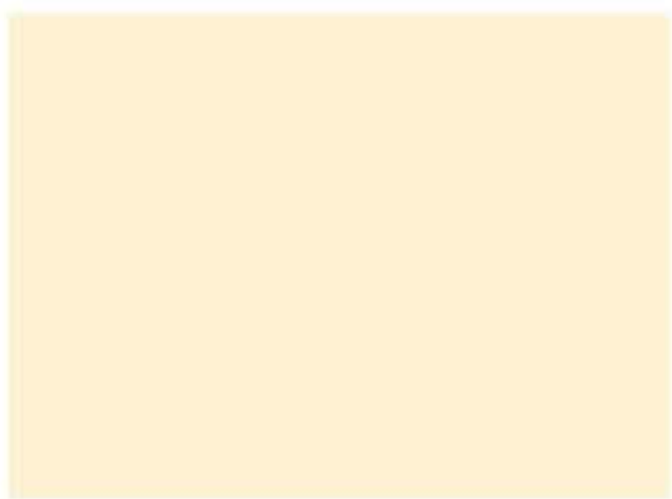
510 - Retama