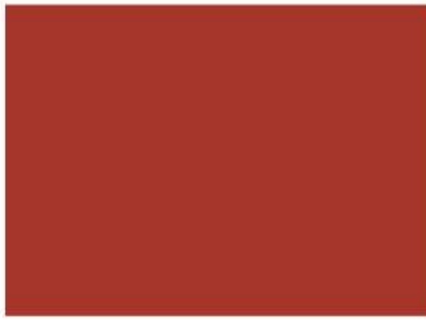
505 - Rojo Maestranza