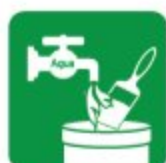
DILUCIÓN Y LIMPIEZA